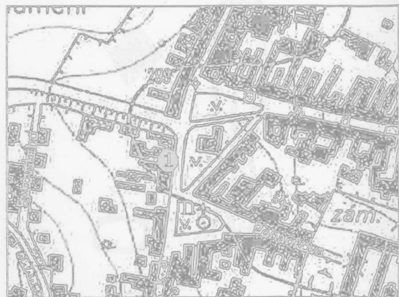
Obr. 3. Brno-Líšeň. 1 místo nálezů. Brno-Líšeň. 1 Fundort.

Brno (Kat. Líšeň, Bez. Brno-město). Karlovo IV. Platz 12. Mittelalter. Siedlung. Rettungsgrabung.