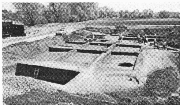
Obr. 5. Medlovice. Pohled na zkoumanou plochu od jihu. Medlovice, Blick auf die Fundstelle von Süden.

v až 3 m mocných akumulací tmavé černozemě vzniklých splachy z výše umístěných poloh.