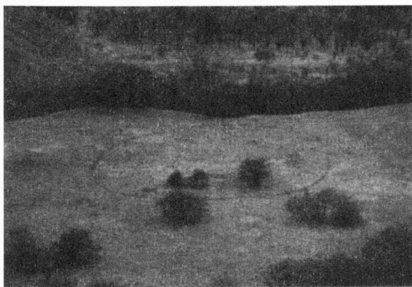
Obr. 1. Bavory – SV okraj obce. Přírodní terasa s kruhovým objektem. Die Naturterrasse mit einer Kreisgrabenanlage.

Obdobné areály nejsou výjimkou ani na sídlištích v době bronzové nebo halštatu. Velké kruhové areály známe z únětického prostředí v Troskotovicích (Kovárník 1999), z věteřovské osady v Šumicích (Stuchlík – Stuchlíková 1999) a jen rámcově do starší doby bronzové datovaný objekt z Vlasatic (Bálek – Hašek 1996, 17-19, obr. 8-10). Rozměry se objevu