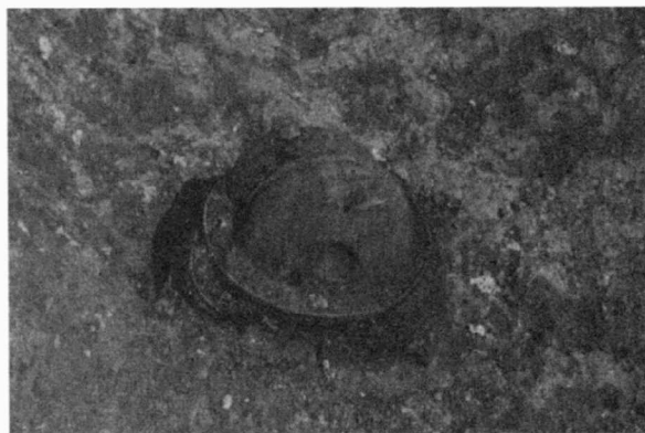
Obr. 3. Kralice na Hané, okr. Prostějov, průmyslová zóna města Prostějova. Výstavba výrobní haly firmy Buderus. Depot bronzových nádob v objektu K 527. Depot der Bronzegefäße im Objekt Nr. K 527.