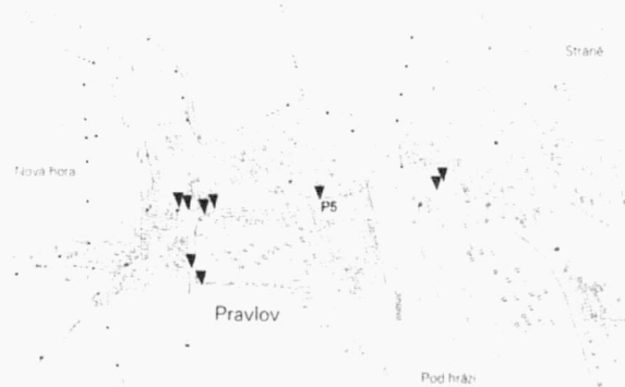
Obr. 46. Pravlov, poloha dokumentovaných profilů. Lage der dokumentierten Profile.

Dohled byl realizován systémem dokumentace dílčích profilů cca 1,5 m hlubokých výkopů pro vodovodní potrubí. V historickém jádru obce nebyla v žádném z dokumentovaných řezů