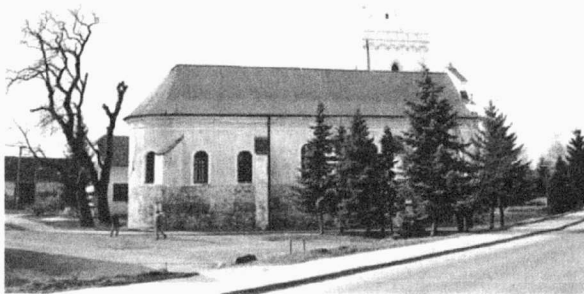
Obr. 48. Pravlov – kostel. Pravlov – Kirche.

zachycena úroveň podloží a v narůstajícím souvrství byly identifikovány pouze novověké navážky (terénní úpravy). O mocném nárůstu terénu v novověku svědčí i starší dochované domy na návsi (např. fara), které jsou vzhledem k současnému terénu „utopeny“ o cca 2 m pod dnešní povrch komunikací. Můžeme se domnívat, že nárůst terénu byl způsoben změnou vodního režimu řeky Jihlavy a obec se z důvodu ochrany před vodou vyvýšila nad okolní terén (některé z dokumentovaných vrstev mají snad i náplavový charakter).