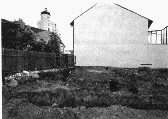
Obr. 45. Pohořelice, Horní náměstí, ilustrační foto. Horní Platz, Gesamtansicht.