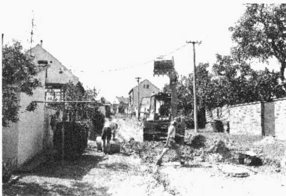
Obr. 43. Podivín, Horní valy, ilustrační foto. Ansicht der Strasse Horní Valy während der Bauarbeiten.

Poněvadž výkop (hloubka cca 0,4-0,5 m) pro podkladové vrstvy pod vlastní povrch budované komunikace zasáhl jen recentní a novověké navážky, soustředil se vlastní archeologický výzkum v podstatě jen na výkop přípojky dešťového svodu do již dříve vybudované kanalizace v jihovýchodní části lokality. Zde bylo ve dvou řezech (P1 a P2) možno pozorovat jílovité podloží (100) a na ně naléhající hnědý půdní typ (104, příp. 101). V řežu P1 navíc byly zachyceny dvě úrovně uloženin s pozůstatky lidských aktivit (mazanice, uhlíky, zvířecí kost). Protože však nebyl z profilů získán žádný keramický materiál nemáme možnost uložení blíže časově zařadit. S velkou