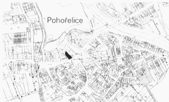
Obr. 44. Pohořelice, Horní náměstí, zkoumaná plocha. Horní Platz. Grabungsfläche.

První zmínky o Pohořelicích ležících na přirozené spojnici Brna a Znojma známe ze 13. století. Roku 1222 se připomíná zdejší farní kostel sv. Jakuba Většího. Koncem 13. a ve 14. století byly Pohořelice věnným městem českých královen nebo moravských markraběnek. Původní středověké město bylo obehnáno i prstencem hradeb, ty však byly roku 1443 po dobytí vojsky moravské šlechty a královských měst strženy a roku 1514 se město stává poddanským v rámci perňštejnského panství. Poté se Pohořelice stávají střediskem novokřtěnců, jedno-