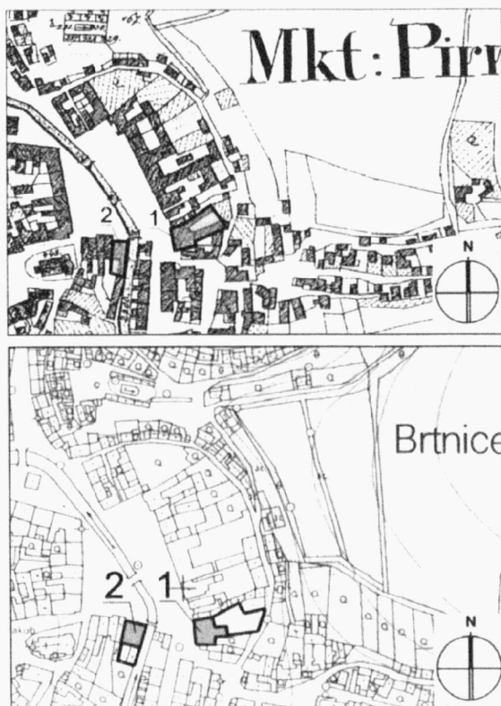
Obr. 2. Brtnice. Poloha zkoumaných parcel č. 2063/1 (2), 5 (1) na mapě stabilního katastru z 1. pol. 19. století (nahore) a současné odvozené mapě 1:5 000 (dole). Brtnice. Lage der erforschten Parzellen Nr. 2063/1 (2), 5 (1) auf dem Urkatasterplan und der gleichzeitigen Landkarte 1:5 000.

V říjnu a listopadu proběhl archeologický výzkum radnice (č.p. 379). Byl vyvolán rekonstrukci objektu včetně snižování podlah v interiérech (obr. 3; 4). Objekt se nachází v jižní fron-