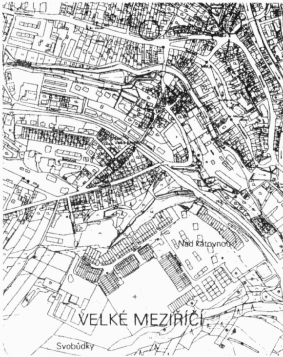
Obr. 46. Velké Meziříčí. Výzkumy společnosti Archaia Brno, o.p.s., v roce 2002 (kroužky). Velké Meziříčí, Rettungsgrabungen im Jahr 2002.

V době pozdějších sporů a válek o dědictví zemí Koruny české mezi Jiřím z Poděbrad a Matyášem Korvínem bylo Velké Meziříčí roku 1450 vypáleno a roku 1468 znovu vydrancováno uherským vojskem krále Matyáše. Největší rozkvět pak zaznamenalo město v 16. století. Rozvoj zastavila třicetiletá válka. Během ní bylo Meziříčí osmkrát vyloupeno (Pišín 1975).