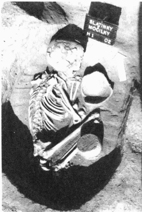
Obr. 3. Slatinky (okr. Prostějov). „Močilky“. Hrob LnK. Slatinky (Bez. Prostějov). „Močilky“. Grab der LBK.

Záchraný archeologický výzkum vyvolaný budováním dvou místních komunikací v délce 250 a 200 m byl zahájen 23. září 2002 a ukončen 24. října téhož roku. Na odhumusené ploše o celkové rozloze 3600 m 2 bylo během uvedené doby prozkoumáno a zdokumentováno 121 objektů. Výzkum prokázal, že celé návrší „Močilky“, určené k zástavbě rodinnými