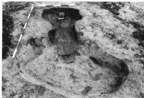
Obr. 1. Slatinice, „Trávníky“. Pec z pozdní doby římské. Slatinice, „Trávníky“. Spätromischer Ofen.

V poloze „Trávníky“, cca 0,5 km V od Slatinic, byly počátkem měsíce října 2002 zahájeny úpravy terénu pro zamýšlenou průmyslovou zónu. Po hrubě skrytce ornice se na podorníční vrstvě vyrýsovaly tmavší zásypy několika objektů. Část plochy o celkové rozloze 1,5 ha se podařilo začistit UDS, a to v místech největší koncentrace archeologických objektů. Začištěna byla i celá plocha kůlové stavby, jež se rozkládala v SV části odhumusené plochy. Kůly byly rozmístěny v řadách