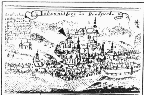
Obr. 11. Javorník, zámek Jánský Vrch. Pohled na zámek Jánský Vrch a město Javorník od východu. Stavby na jihovýchodě označeny šipkou. Reprofoto podle originálu kresby F. B. Wernera z roku 1750 (podle Richterová – Kaueroová – Peřinová 1995, 35-obr.1).

Javorník, Schloß Jánský Vrch. Ostansicht des Schlosses Jánský Vrch und der Stadt Javorník. Die Bauten im Südosten sind mit einem Pfeil bezeichnet. Reprofoto nach der Originalzeichnung von F.B. Werner aus dem Jahre 1750 (laut: Richterová – Kaueroová – Peřinová 1995, 35 - Abb. 1).