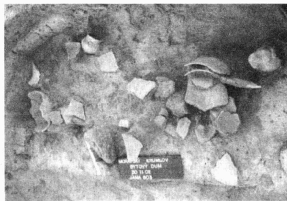
Obr. 6. Moravský Krumlov (okr. Znojmo). „Zachráněná“. Celkový pohled na koncentraci nálezů podolské kultury v jámě 503.

Moravský Krumlov (Bez. Znojmo). „Zachráněná“. Gesamttaugenblick auf die Konzentration der Funde der Podol-Phase SDPP (Grube Nr. 503).