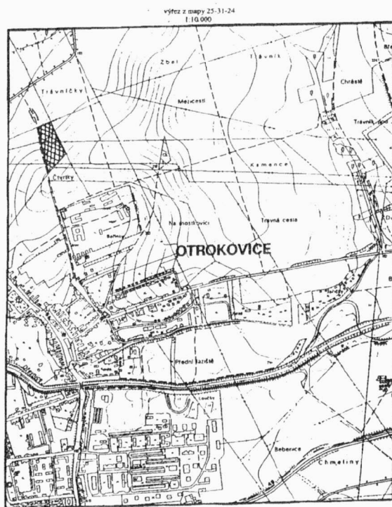
Obr. 2. Otrokovice, „Čtvrtky“. Poloha naleziště – výřez z mapy ZM 1:10 000. Otrokovice, Flur „Čtvrtky“. Lage der Fundstelle – Ausschnitt aus der Karte ZM 1:10 000.

Na trase nově budované komunikace severovýchodním směrem od původního městského jádra Otrokovic bylo v jarních měsících roku 2002 zachyceno nové, dosud neznámé pravěké sídliště. Naleziště je situováno na ZM 1:10 000, č. l. 25-31-