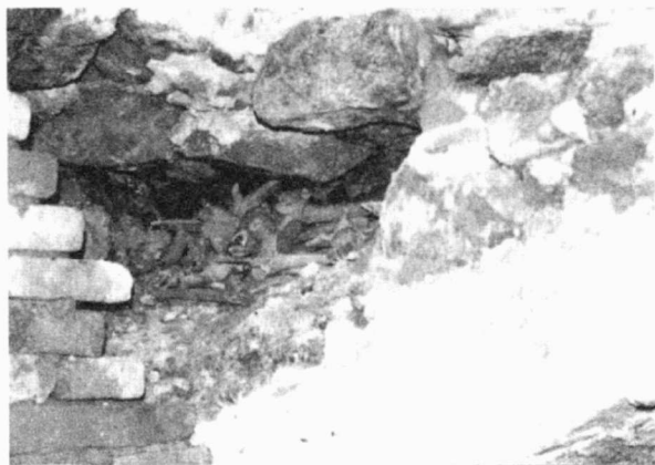
Obr. 44. Třebíč-Podklášteří, Žerotínovo nám. 5. Druhotně uložené kosterní pozůstatky.

Třebíč-Podklášteří, Žerotínovo náměstí 5. Sekundär deponierte menschliche Knochenüberreste.