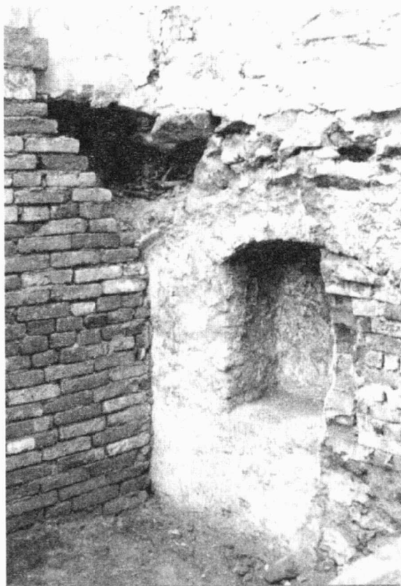
Obr. 45. Třebíč-Podklášteří, Žerotínovo nám. 6. Druhotně uložené kosterní pozůstatky.

Při asanaci stávajícího a výstavbě nového domku na parcele č. 17/2 došlo k odkryvu druhotně uložených kosterních lidských pozůstatků. Ty patrně pocházejí z období středověku. Lokalita se nachází přímo pod východní hradební zdí areálu benediktinského kláštera. V těchto místech se zástavba nacházela již začátkem 18. století, jak dokládá nejstarší pohled