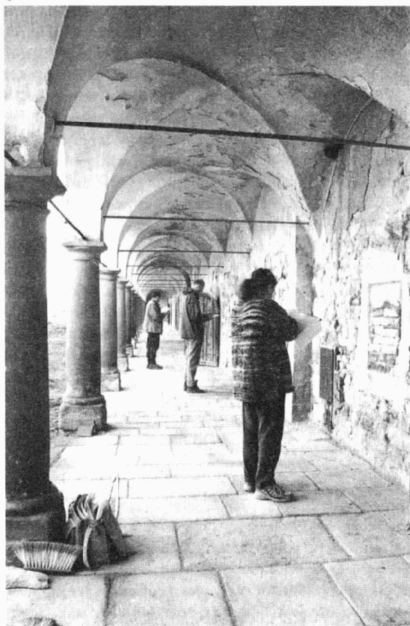
Obr. 30. Oslavany – klášter. Probíhající kresebná dokumentace. Oslavany – Kloster. Dokumentation.