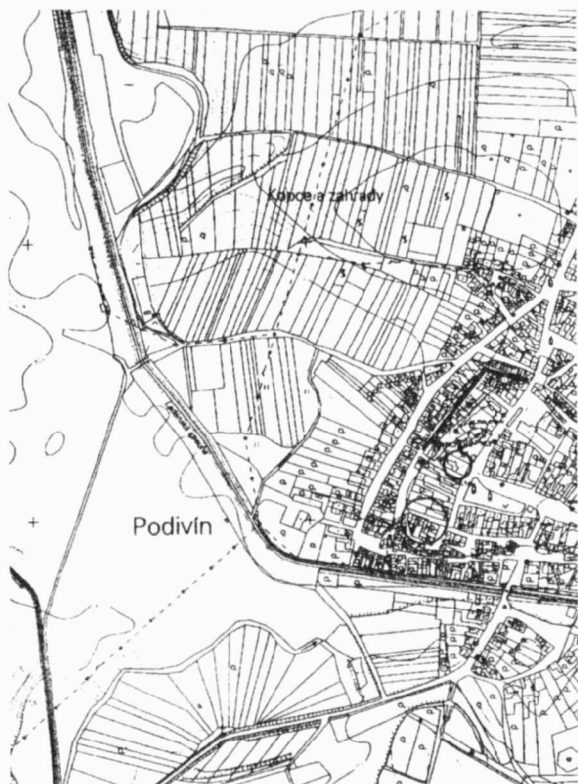
Obr. 31. Podivín – výzkumy společnosti Archaia Brno v roce 2002 (tučná čára a kroužky). Podivín – Rettungsgrabungen im Jahr 2002

10. do 17. 11. 2002 na ploše předmětné stavby záchranný archeologický výzkum.