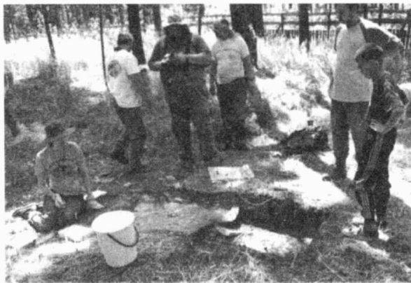
Obr. 4. Náměšť na Hané (okr. Olomouc). „Džbán“. Pracovní snímek z výzkumu mohyly KNP. Náměšť na Hané (Bez. Olomouc). „Džbán“. Arbeitsblick.

hrobu datuje mohylu do první fáze mladšího stupně kultury s nálevkovitými poháry (KNP IIA). Násyp mohyly obsahoval značné množství intruze, zejména keramiky (MMK, KNP), štípané industrie a drobných úlomků spálených kostí. Vůbec poprvé se podařilo pod mohylou zachytit starší objekt, který keramika datuje do staršího stupně KNP. Ve svrchní části násypu, poněkud stranou od jeho ideálního středu, byla bez jakýchkoliv souvislostí nalezena plochá měděná sekera se zřetelnými otisky textilie v zoxidované povrchové vrstvě. Je pravděpodobné, že se v tomto případě nejedná o intruzi, ale o předmět pietně uložený do pláště mohyly.