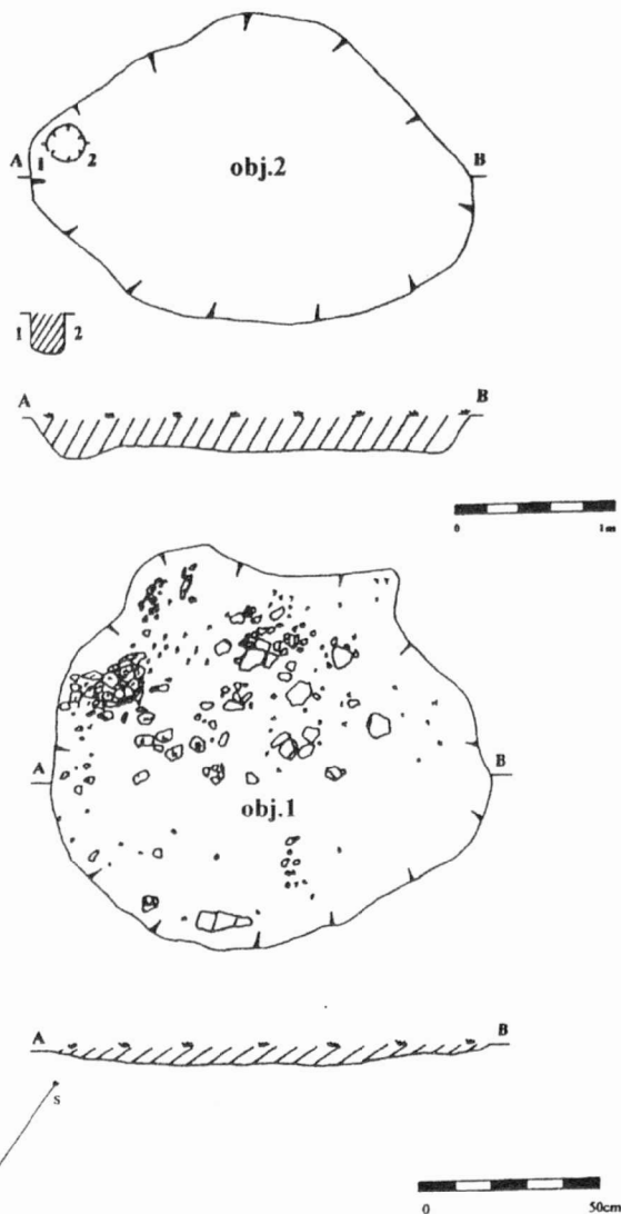
Obr. 3. Otrokovice, „Čtvrtky“. Půdorysy halštatských objektů 1 a 2. Otrokovice, Flur „Čtvrtky“. Grundrisse hallstattzeitlicher Objekte 1 und 2.

24, od Z s. č. 21 a 24 mm, od J s. č. 256 a 251 mm. Při průzkumu zde byly zjištěny tři oválné mísovité zahloubené sídlištní objekty, jejichž vrchní části byly již dříve zničeny hlubokou orbou a skrývkou orníční a podorníční vrstvy. V jednom z objektů bylo objeveno dno destruovaného otopného zařízení – pece. Podle nepočteného keramického materiálu lze toto nově objevené sídliště zařadit nejspíše do počátečního stadia platěnické fáze kultury lužických popelnicových polí (obr. 2-3).