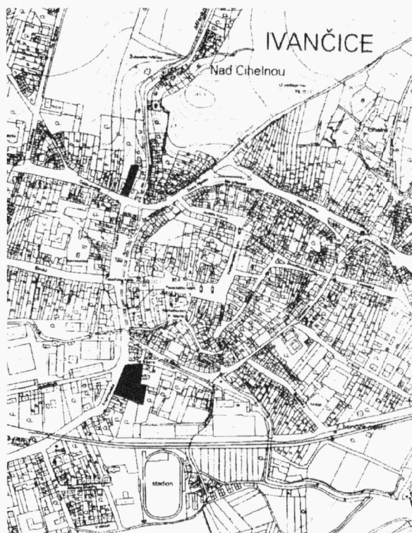
Obr. 5. Ivančice. Záchrané výzkumy (černé plochy) v roce 2002. Ivančice. Rettungsgrabungen im Jahr 2002.

Oslavská ulice, parcela číslo 304. Sídlištní aktivita. Středověk. Záchraný výzkum.