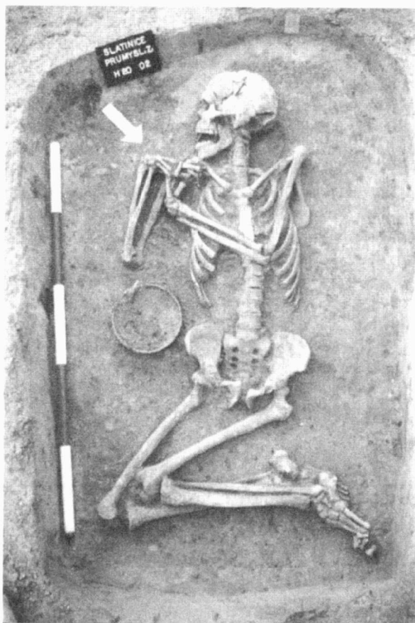
Obr. 8. Slatinice (okr. Olomouc). „Trávníky“. Nitranské pohřebiště, hrob č. 20. Slatinice (Bez. Olomouc). „Trávníky“. Gräberfeld der Nitra Kultur, Grab Nr. 20.