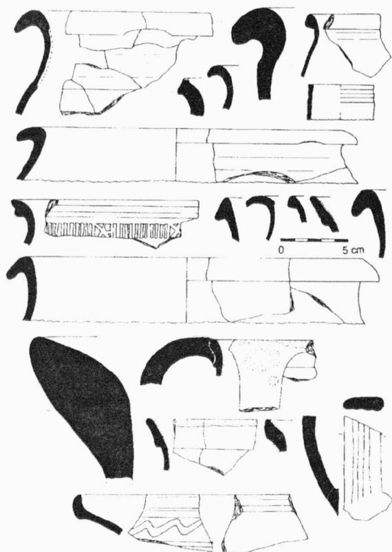
Obr. 2. Budkov – zámek – keramika z vnitřního nádvoří zámku z 15.-16. století. Budkov – Schloß – Keramik aus dem Innenhof des Schlosses aus dem 15.-16. Jahrhundert.

branou pak byl zachycen průběh barokního cihelného mostu, který překlenul původní středověký příkop po zániku jeho funkce. Na čtyřech místech pak byly zachyceny zbytky kamenné, pravděpodobně parkánové hradby o šířce 1 m. Nalezená keramika patří do průběhu 15. a 16. století.