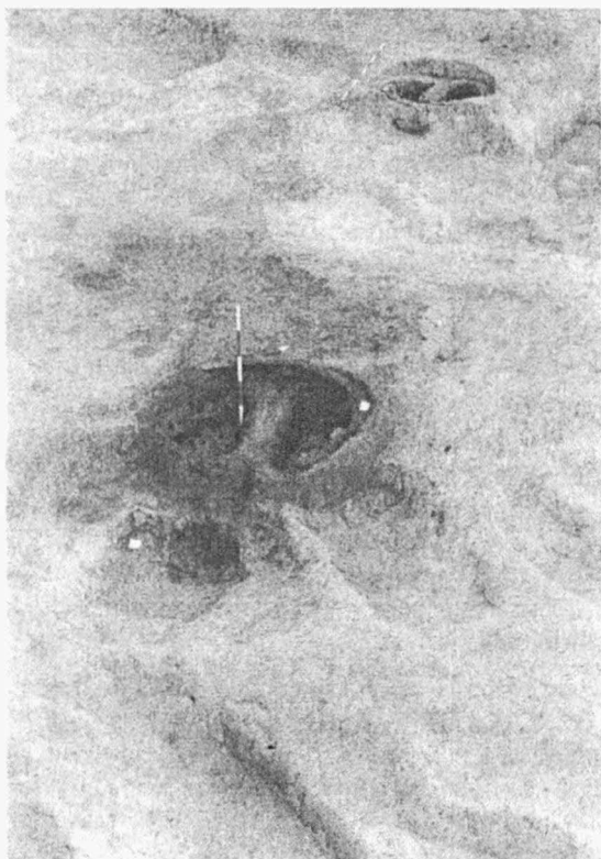
Obr. 11. Vávrovice, „U Palhanské cesty“. Hrnčířské pece k. 501 a 637 z pozdní doby římské. Vávrovice, „U Palhanské cesty“. Keramiköfen Nr. 501 und 637 der späten römischen Kaiserzeit.

dobí můžeme zahrnout i 2 mírně zahloubené chaty s kůlovou konstrukcí (k. 607 a 622) a snad i kompletní půdorys nadzemního kůlového domu.