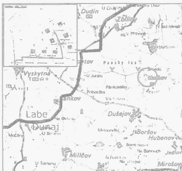
Obr. 4. Dušejov, Maršov. Poloha lokality Dušejov, Maršov. Position der Lokalität

Osada Maršov je původně středověkou vsí vysazenou v období vrcholně středověké kolonizace. Ačkoliv písemné zprávy z nejstaršího období chybí, lze volně uvažovat o průběhu 13. století. Maršov byl vysazen prakticky na úpatí hlavního českomoravského masivu, asi jen 2000 m od hlavního evropského rozvodí Dunaj – Labe. Údolí potoka překračuje nadmořskou výšku 600 m. Současný půdorys a rozsah osady je značně pozměněn a zredukován, avšak poloha v mělkém údolí