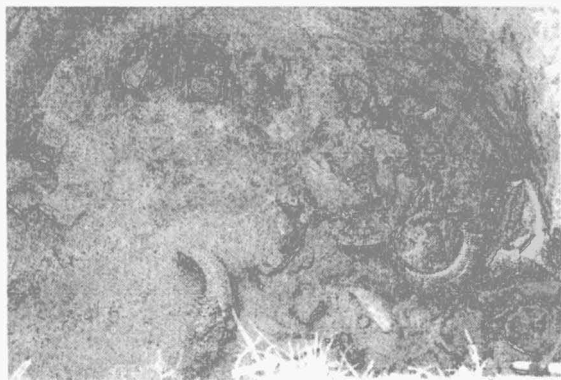
Obr. 3. Kostelec na Hané, „Kozí brada“. Dno objektu K508/01 s rozbítenými nádobami KNP. Kostelec na Hané, „Kozí brada“. Gefäßebruchstücke der TBK am Boden des Objektes K508/01.

Podobné výšinné lokality s jevišovickými osídleními byly zjištěny v blízkém okolí u Čučic (Kuča, Vokáč v tisku), Lhánic, Hartvíkovic (Košťuřík a kol. 1986) a na dalších místech. „Kozí hřbety“ můžeme přiřadit ke skupině již dříve objevených