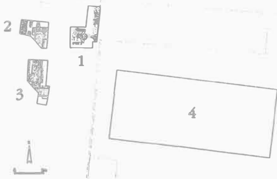
Obr. 4. Bučovice, zámek. Celková situace ploch prozkoumaných při záchranném a zjišťovacím výzkumu v letech 2000 a 2001. Bučovice, Schloß. Gesamtsituation der in den Jahren 2000 und 2001 während der Rettungs- und Testgrabung erforschten Flächen.