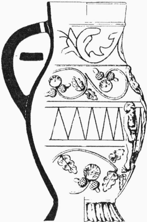
Obr. 3. Brno (kat. Zábřdovice). Džbán nalezený v jímkce ze 16. stol. (kresba: A. Krechlerová). Brno (Katastralgebiet Zábřdovice). Krug aus der Abfallgrube aus dem 16. Jahrhundert.

Pozdně středověkému až raně novověkému období náležely početné jímky, jejichž kumulace zaujímal J okraj zkoumaného areálu. Z jímek pochází početná kolekce keramických nádob a jejich fragmentů. Nejtypičtějším představitelem pol. 15. stol. byly loštické poháry, následně období prezentovaly poháry brněnské ze 16.-17. stol.