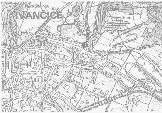
Obr. 9. Ivančice. 1 - místo nálezu. Ivančice. 1 - Fundort.

Hrušovany nad Jevišovkou (Bez. Znojmo), „Sever“. Neuzeit. Siedlung. Rettungsgrabung.