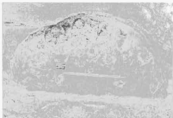
Obr. 3. Hrádek. Zásobní jáma 501 s keramickým depotem mladší fáze únětické kultury.

I v druhé zásobní jámě (502) jsme měli možnost zdokumentovat ojedinělý příklad rituálních praktik starší doby bronzové. Objekt byl v severní polovině z více než jedné třetiny zničen výkopem. Ve zbylé části se nám však podařilo ve dvou úrovních zachytit koncentraci nálezů. Objekt měl nepravidelně kruhový tvar o průměru ústí 1,58 m a dna 2,22 m. Dno se nacházelo 0,94 m od úrovně podloží. Na rozhraní zánikového horizontu a vlastní výplně objektu, v její horní třetině, se nacházely 4 lopatky, zlomky žeber a dlouhých kostí hospodářských zvířat a především tři keramické nádoby. Jednalo se drobný kónický šálek, položený na bok, mísu s drsněnou výduť a hlazeným, vně vyhnutým okrajem s plastickými výčnělky a dvouuouchou nádobu s leštěným hrdlem a prstovanou výduť. Z mísy byl vylomen fragment okraje, který byl dislokován jeden metr od zbytku nádoby. Dvouuchá nádoba byla rozbita a rozptýlena kolem jižního okraje objektu. Na vlastním dně se podařilo odhalit druhou situaci. U západní stěny objektu se nacházely původně dvě kompletní lebky skotu, které byly položeny dolní čelistí vzhůru. U nich se nacházely odlámané klouby dlouhých kostí, skelet drobné šelmy (?) a především kostěná lopatka pádlovitého tvaru, vyřezaná ze zvířecí lopatky. Do jižní stěny pak byla vuměle vyhloubeným výklenku vsazena velká pískovcová plotna o rozměrech 1,2x1,1 m, na níž lze pozorovat stopy opotřebení a zářezů.