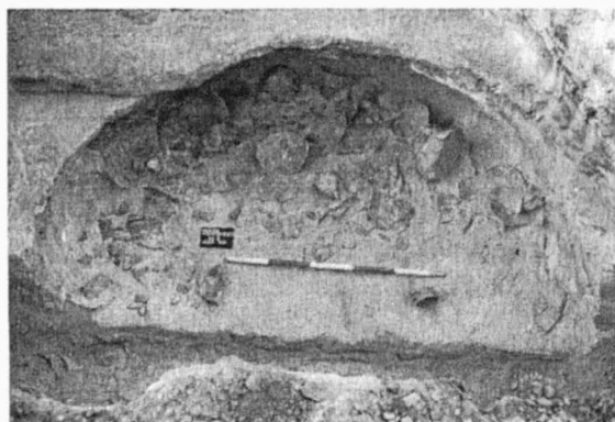
Obr. 3. Hrádek. Zásobní jáma 501 s keramickým depotem mladší fáze únětické kultury.

I v druhé zásobní jámě (502) jsme měli možnost zdokumentovat ojedinělý příklad rituálních praktik starší doby bronzové. Objekt byl v severní polovině z více než jedné třetiny zničen výkopem. Ve zbylé části se nám však podařilo ve dvou úrovních zachytit koncentraci nálezů. Objekt měl nepravidelně kruhový tvar o průměru ústí 1,58 m a dna 2,22 m. Dno se nacházelo 0,94 m od úrovně podloží. Na rozhraní zánikového horizontu a vlastní výplně objektu, v její horní třetině, se nacházely 4 lopatky, zlomky žeber a dlouhých kostí hospodářských zvířat a především tři keramické nádoby. Jednalo se drobný kónický šálek, položený na bok, mísu s drsněnou výdutí a hlazeným, vně vyhnutým okrajem s plastickými výčnělky a dvouuchou nádobu s leštěným hrdlem a prstovanou výdutí. Z mísy byl vylomen fragment okraje, který byl dislokován jeden metr od zbytku nádoby. Dvouchá nádoba byla rozbita a rozptýlena kolem jižního okraje objektu. Na vlastním dně se podařilo odkrýt druhou situaci. U západní stěny objektu se nacházely původně dvě kompletní lebky skotu, které byly položeny dolní čelistí vzhůru. U nich se nacházely odlámané klouby dlouhých kostí, skelet drobné šelmy (?) a především kostěná lopatka pádlovitého tvaru, vyřezaná ze zviřecí lopatky. Do jižní stěny pak byla v uměle vyhloubeném výklenku vsazena velká pískovcová plotna o rozměrech 1,2x1,1 m, na ní lze pozorovat stopy opotřebení a zářezů.