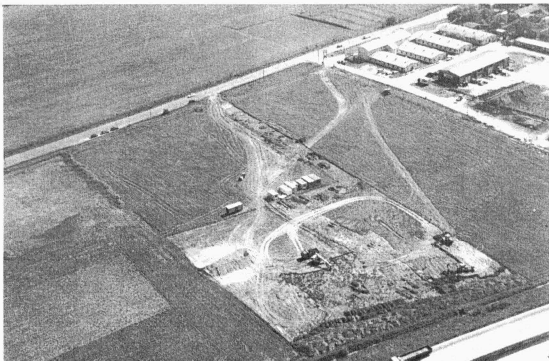
Obr. 11. Popůvky I. Letecký snímek plochy výzkumu OCBB. Popůvky I, Luftbild der Ausgrabungsfläche von OCBB.