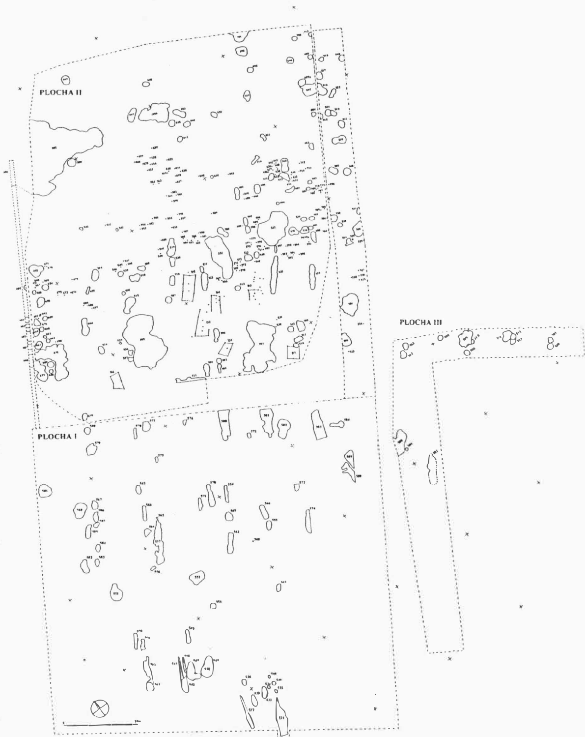
Obr. 10. Popůvky, celkový plán výzkumů: I – Obchodní centrum Budějovického Budvaru; II – Skladový areál Italinox, s.r.o.; III – Obchodní a servisní centrum Renault Lancar. Popůvky, Gesamtplan der Ausgrabungen I-III.