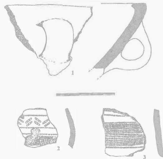
Obr. 8. Přerov – Předmostí. Keramika KZP. Keramik der Glockenbecherkultur.