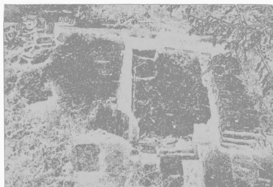
Obr. 3. Bučovice – zámek. Rekonstrukce kanalizačního řádu. Zeď gotického kostela s bočním ústupkovým portálem datovaným kolem roku 1250 a cihelné zpevňovací klenební pasy z počátku 20. století. Rekonstruktion der Kanalisation. Das gotische Mauerwerk um 1250 und die Ziegelwölbung (Anfang des 20. Jh.).

Bučovice (Bez. Vyškov), „Schloss“. Mittelalter, Neuzeit. Rettungsgrabung.