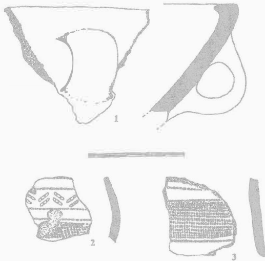
Obr. 8. Přerov – Předmostí. Keramika KZP. Keramik der Glockenbecherkultur.