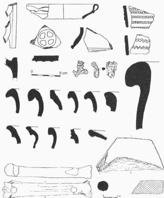
Obr. 39. Třebíč, vnější nádvoří zámku. I. č. 13/2000. Výběr materiálu. Materialauswahl.

Areál zámku, baziliky sv. Prokopa a hospodářské objekty. Středověk, novověk. Klášter. Záchranný výzkum.