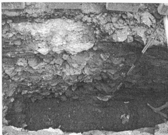
Obr. 40. Uherské Hradiště, Kollárova-Svatováclavská ul. Zed' barokního bastionu. Barockmauerwerk.

směřoval severním směrem na ulici Kollárovu, byla na rozhraní dvora a ulice zachycena destrukce kamenné zdi. Zed' tvořily na maltu kladené kameny, zcela výjimečně i cihly. Zed' procházela ve směru SZ-JV. Zachycena byla v šíři 200 cm a délce 48 cm. Od vlastní silnice na ulici Kollárově byla vzdálena 50-80 cm. Zed' začínala 30-55 cm pod současným povrchem a svou výškou přesahovala hloubku vlastního výkopu, tedy 220 cm. Základovou spáru se proto nepodařilo zachytit.