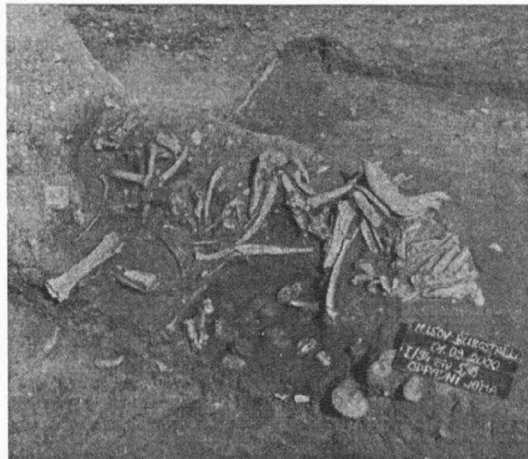
Obr. 2. Mušov-Burgstall. Kumulace zvířecích kostí v odpadní jámě. Tierknochen in einer Abfallgrube.

Pokračoval též výzkum na temeni Hradiska, zaměřený především na prozkoumání bezprostředního zázemí budov, odkrytých A. Gnirsem v letech 1927-1928 (Gnirs 1976, 80-115). K vyhodnocení kůlových konstrukcí, odkrytých z větší části již v předchozí sezóně ve čtvercích E 16-17, F 14-17 (Komoróczy 2000, 146-147), je třeba dalších odkrytí, terénní zjištění však naznačují značnou různorodost použitých architektonických prvků na celém Hradisku. Ve čtverci G 13 byla též odkryta východní část V. místnosti, náležící ke Gnirsem odkrytému komplexu budov, označovaných jako lázně (balenum) (Tejral 1986, 395d. i s další literaturou). Bylo zdokumentováno zhruba 2 m dlouhé zděné praefurnium, část poměrně špatně zachované maltové podlahy o velikosti 145 x 55 cm a zbytky pilířků hypokausta (obr. 3). U 21 úplně odkrytých pilířků byl stav zachování následující: 2 pilíře se zachovaly do výšky 5 řad, 1 pilíř do výšky 4 řad, 3 pilíře do výšky 3 řad, 9 pilířů do výšky 2 řad a 6 pilířů do výšky 1 řady. V konstrukci podpodlažního topení byly použity pálené cihly, z nichž 21 exemplářů lze přiřadit k typu later pedalis (ca. 30 x 30 cm) a 26 k typu later bessalis (ca. 20 x 20 cm). Ve dvou případech se zjistilo zastoupení typu later sesquipedalis (jehož „normované“ rozměry jsou ca. 45 x 45 cm), v nichž je třeba spatřovat, ač se nenacházely v původní poloze, součásti původní konstrukce suspensury, nesoucí litou podlahu.