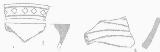
Obr. 7. Přerov – Lýsky. Keramika KZP. Keramik der Glockenbecherkultur.

Přerov (Kataster Lýsky, Bez. Přerov), „Nad Žebračkou“. Glockenbecherkultur. Siedlung. Terrainbegehung.