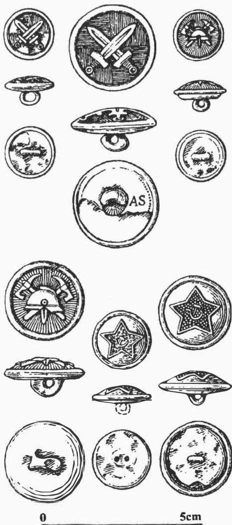
Obr. 12. Nikolčice-Nový dvůr. Výběr knoflíků uniforem z hromadného hrobu. Auswahl der Uniformknöpfe aus dem Massengrab.

NIKOLČICE-NOVÝ DVŮR (okr. Brno-venkov) Bezejmenná trať. Novověk. Hromadný hrob. Záchraný výzkum.