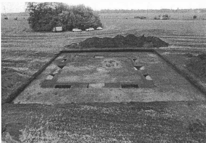
Obr. 1. Žatčany, okr. Brno-venkov. Pohled na čtvercový příkop s hrobem po odkrytí a začišťení plochy (nahore) a po vybrání (dole).