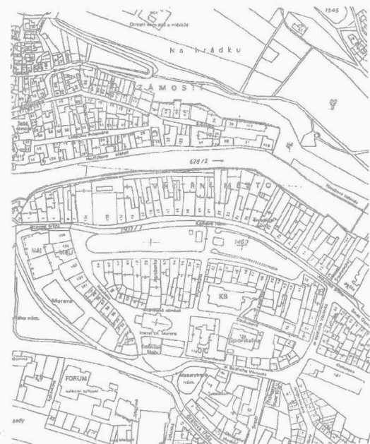
Obr. 1. Výsek z katastrální mapy Třebíče se zakreslenou lokalitou. Lage der Befunde.

Od dubna 1998 až do května 1999 byl, v návaznosti na celkovou rekonstrukci a opravu domu, realizován archeologický výzkum v dvorním traktu a v suterénu budovy v Třebíči, Karlově náměstí č. 25. Výzkum byl uskutečněn na základě smlouvy o dílo mezi společností Archaia v.o.s. Praha a Jihomoravskou energetikou, a.s. Brno ve spolupráci s Taranis, o.p.s.