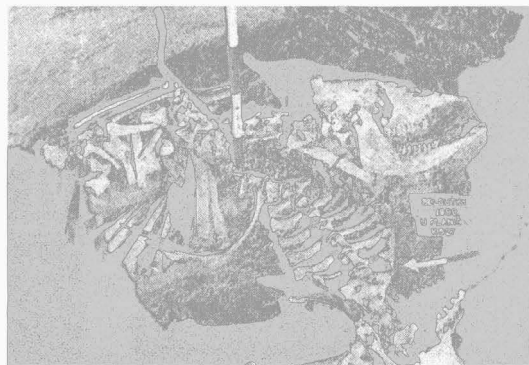
Obr. 2. Seloutky - "U pláničky". Pohled na skelet skotu v jámě 630 (polovina 16. století). Rindskelet in Grube 630.

Bei Oberflächenlesen im April 1999 wurden auf Grundstücken vor den Anwesen Nr. 8 und 35 zwei kleinere Kollektionen mittelalterlicher und neuzeitlicher Töpferware ab dem 15. Jahrhundert zusammengebracht. Ältere Funde wurden in diesem typischen Reihen-Hufendorf aus der Periode der im 13. Jahrhundert gipfelnden Kolonisation des Drahaný-Hügellandes bisher nicht gewonnen.