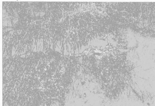
Obr. 3 – Porušení valu na jihu s kamenitou výplní. Destruktion des Walles mit Stein-ausfüllung.