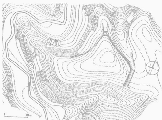
Obr. 1 – Terénní náčrt hradiska „Na Hané“. Plan des Burgwalles.

Hradisko se nachází na levobřežní ostrožně v záhybu Velké Hané v lesní trati „Na Hané“ asi 1500 m severovýchodně od Rychtářova na jižním okraji Drahanské vrchoviny v nadmořské výšce 415 m n. m. Jako „Valy“ ho na základě popisu F. Sochora (1938, 115-117) ne zcela přesně zdokumentoval E. Černý (1992). Asi 90 m široký kofen ostrožny přepažuje mohutný val, který díky odlesnění okolí jasně vyniká. Vůči dnu předloženého příkopu má 5 m a nad terémem hradiska 2 m výšky. Příkop je 15 m široký, má oproti úrovni šije hloubku 3,5 m a na severu se vytrácí v přírodní úžlabině. Po její hraně běží již snížený val až ke klesajícímu jazyku, který je přerušen 20 m širokou rozsedinou bývalého příkopu. Na zbývajících stranách pětiúhelného areálu val chybí a k ohrazení bylo asi použito dřeva. Narušení valu na jižním konci odhaluje kamenité jádro blíže čelní části a zeminu propálenou do červena, což naznačuje zánik požárem.