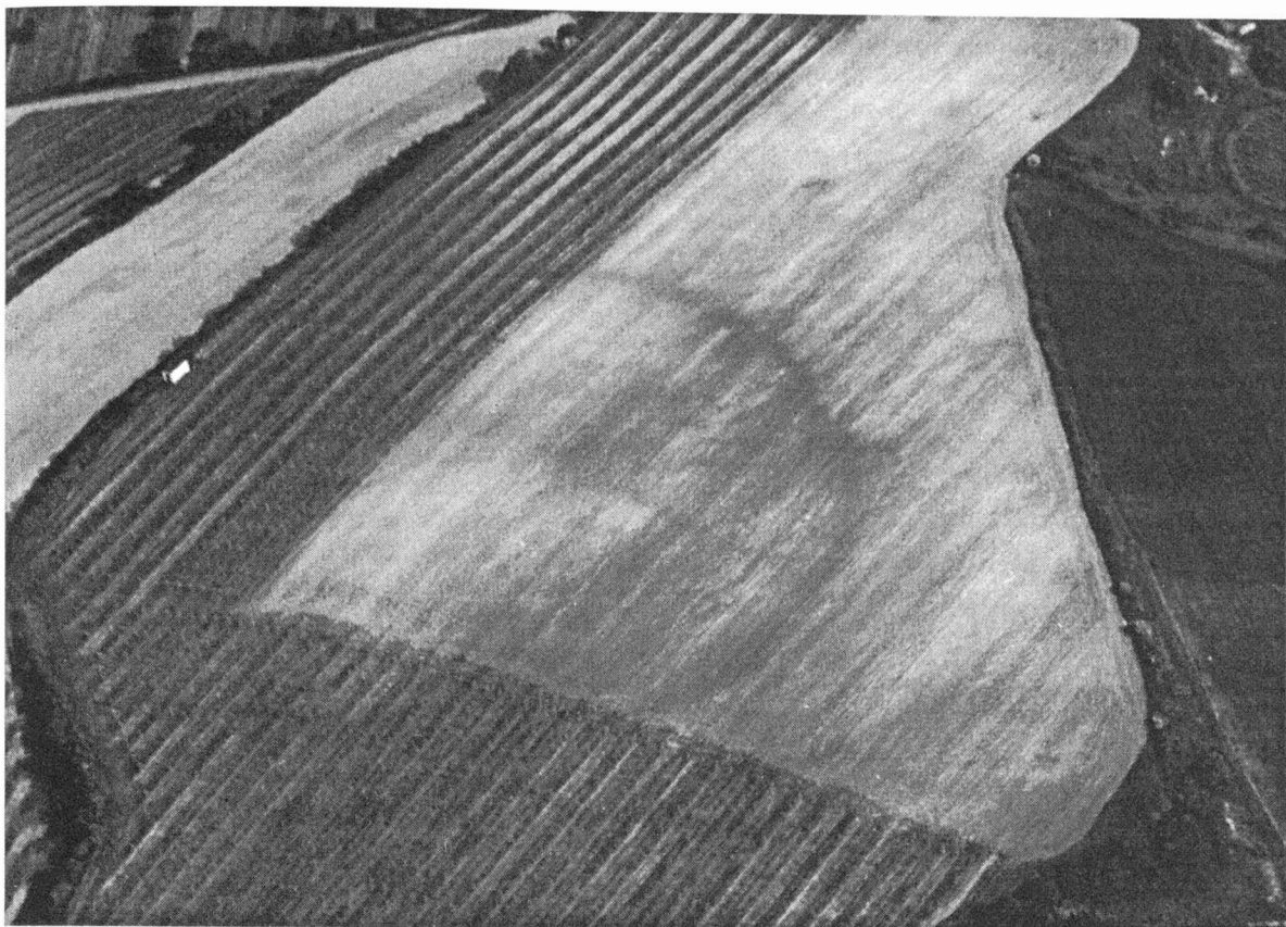
Obr. 3. Kobylyí okr. Břeclav. Letecký snímek hradiska v trati „Vígrunty“. An aerial view of the fortification in the „Vígrunty“ tract.