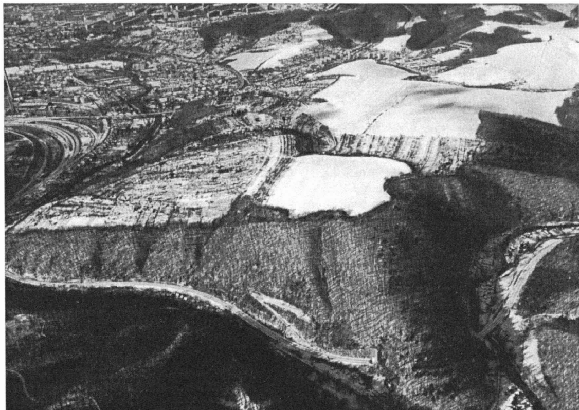
Obr. 1. Brno – Obřany okr. Brno – město. Letecký dokumentační snímek hradiska. An aerial view of the hillfort.