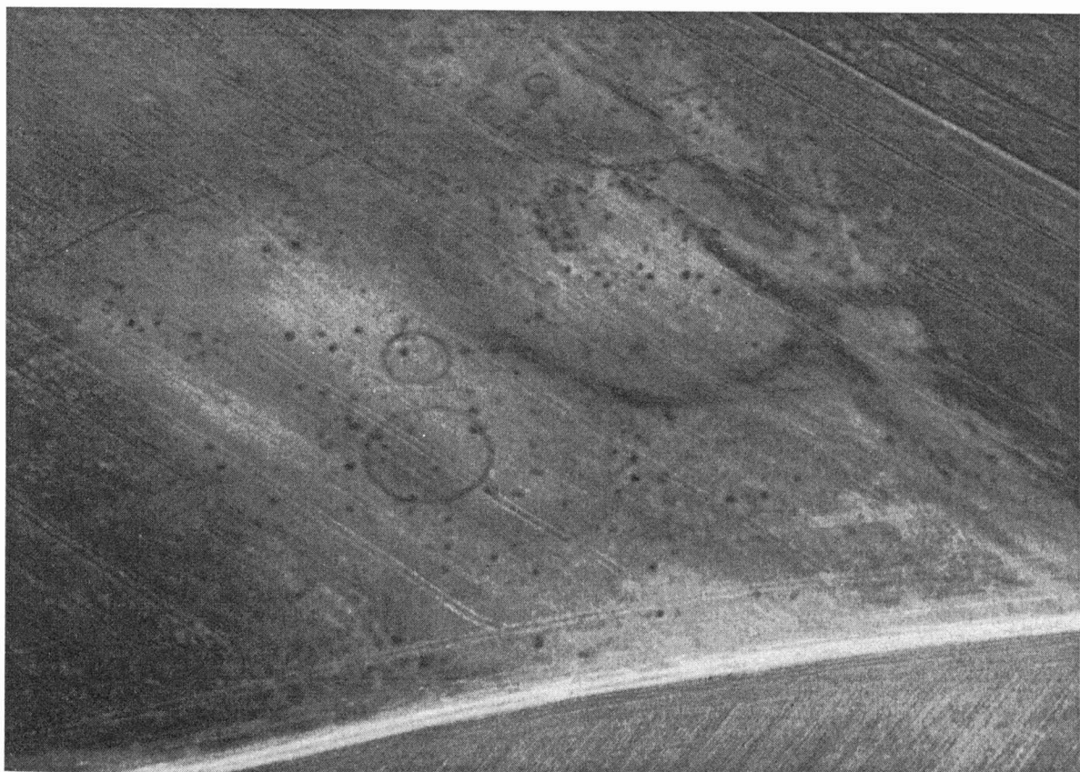
Obr. 4. Strachotín okr. Břeclav. Letecký snímek bodových a kruhových porostových příznaků. An aerial view with spot and circular features.