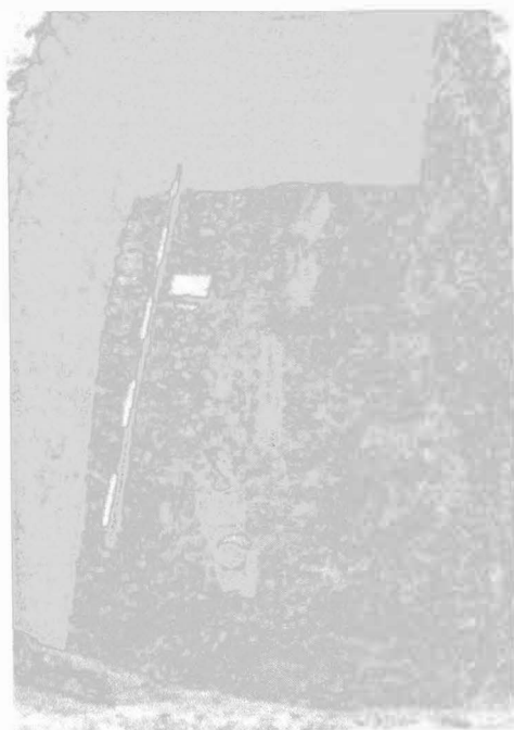
Obr. 1: Olomouc - Slavonín, Horní lán. 1 - detail uložení šperků v hrobě č. 70, 2 - hrob č. 102.