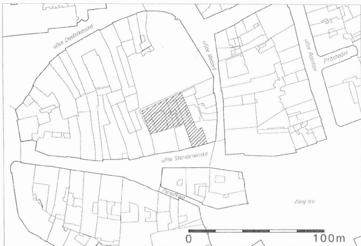
Obr. 1: Brno, Starobrněnská č. 2, 4 - 6, 8, parc. č. 448, 452, 453 (akce UB49/96). Zaměření plochy výzkumu.