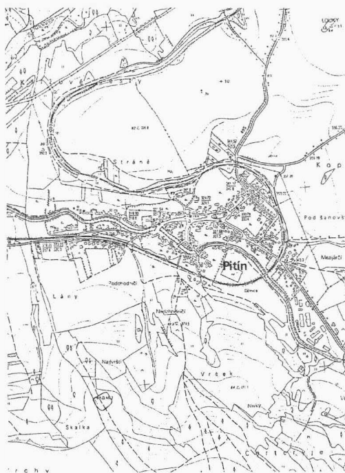
Obr. 1: Poloha hradiska a obce Pitína, výsek z mapy 1 : 10 000 č. 25-34-23. Hradisko barevně vyznačeno.

V severovýchodní části okresu Uherské Hradiště, v CHKO Bílé Karpaty, jižně obce Pitín (asi 900 m od vlakové stanice Pitín - zastávka), na kótě 466,2, v místech s lidovým názvem „Slaniska“, bylo novější terénní prospekci lokalizováno již dříve známé a zmiňované hradisko Pitín (rkp. I.L.Červinka, Jan Pavelčík) (obr. 1).