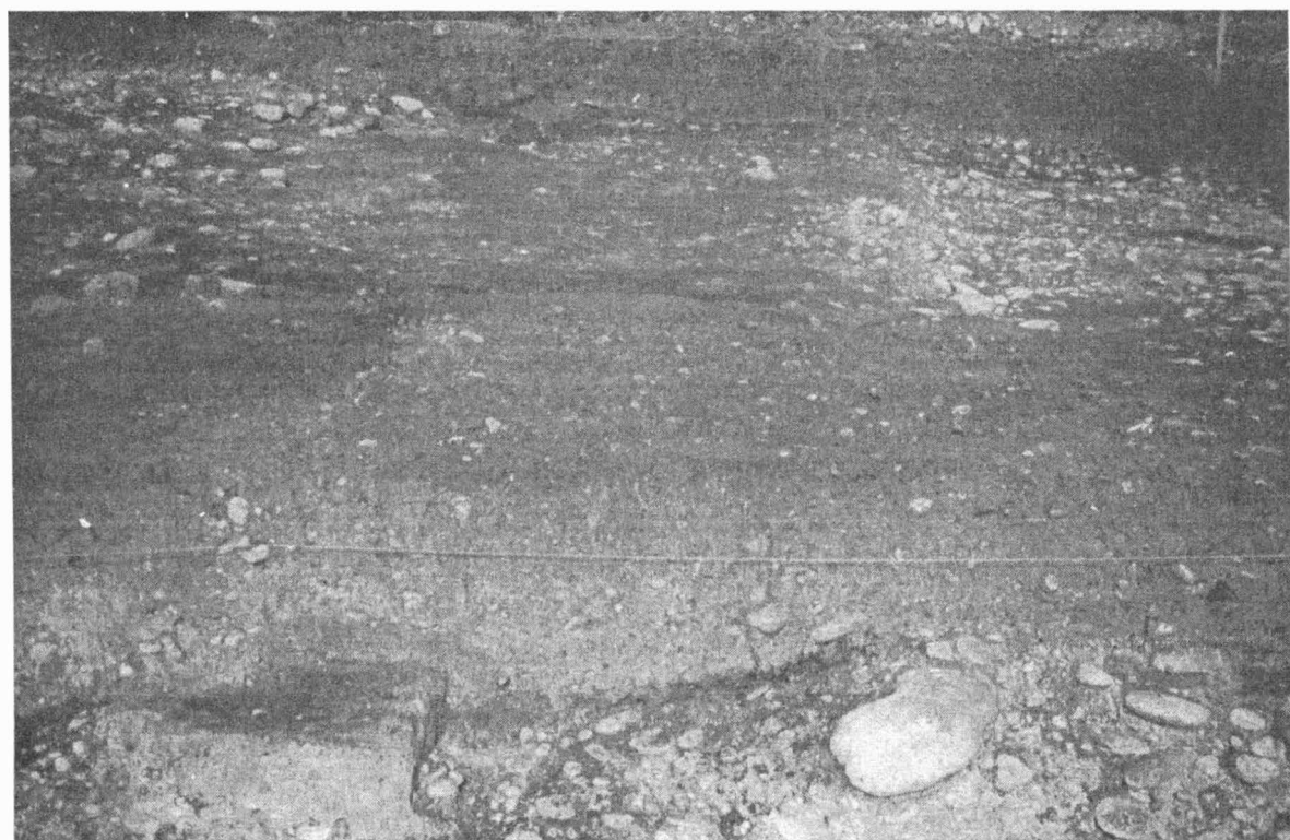
Obr. 2. Mušov – Burgstall 1998. Řez pecí