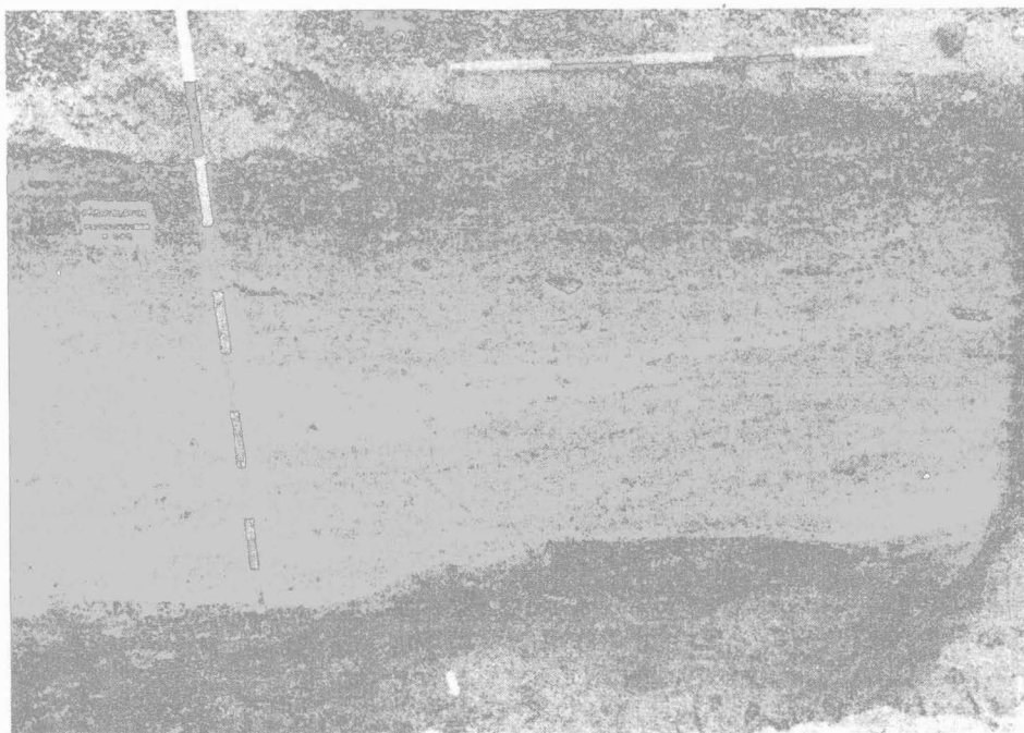
Obr. 1. Přemyslovice, okr. Prostějov - sídliště KNP. 1,2: objekty K502 a K503