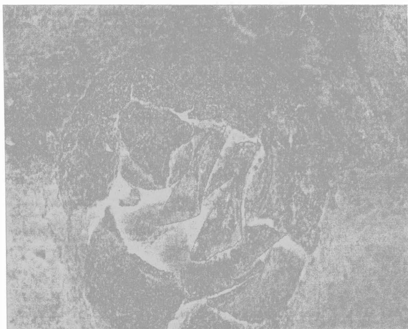
Obr.1. Služín, okr. Prostějov - Zábrusky. 1 - místo nálezu depotu (nahore), 2 - depot před vyzvednutím (dole)