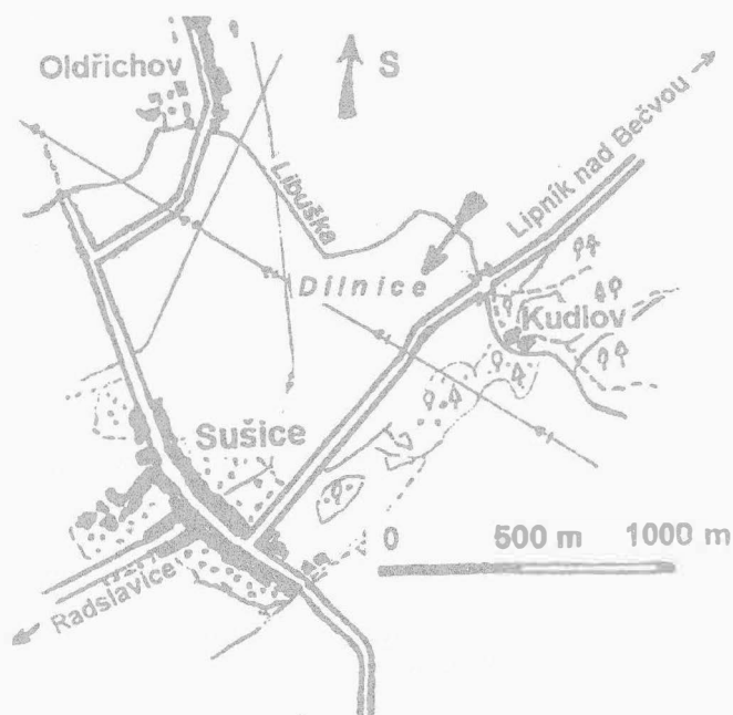
Obr. 1. Sušice, okr. Přerov. Lokalizace naleziště

Dne 2.3.1997 autor příspěvku a Daniel Fryč u osady Kudlov, obec Sušice (obr. 1) získali terénním průzkumem úlomky pravěké keramiky a kamennou štípanou industrii (obr. 2:1-6). Dalšími povrchovými sběry byly nalezeny 3 broušené sekerky (obr. 2:7-9), kopytovitý