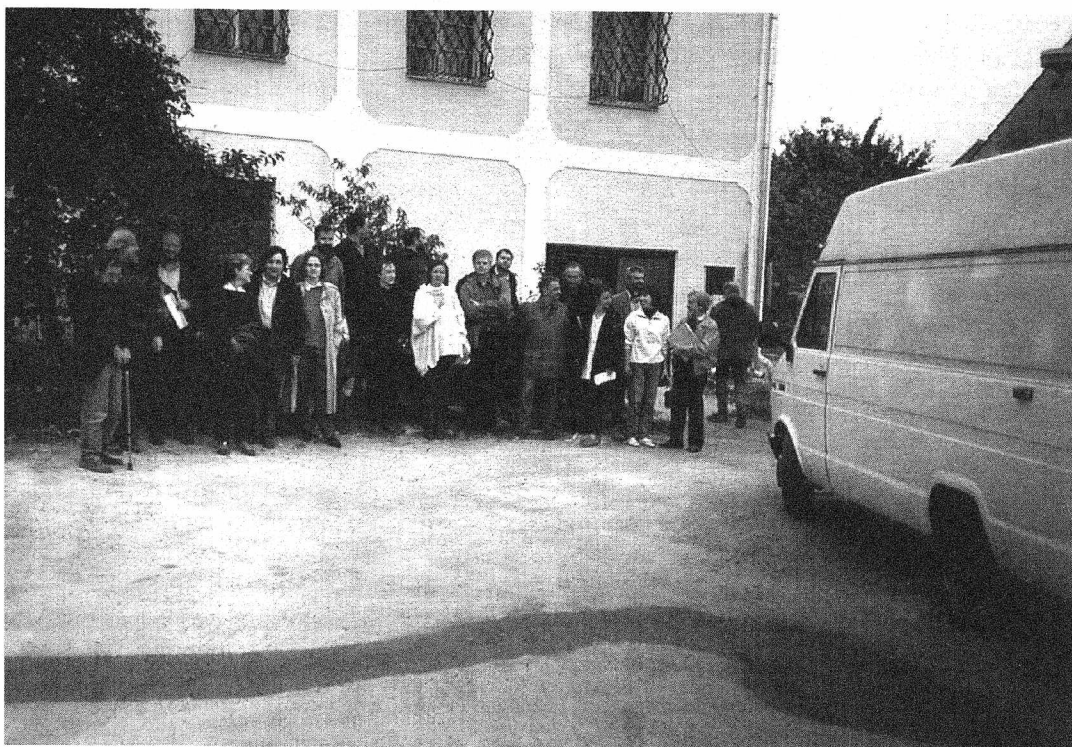
Účastníci konference ESF před budovou pracoviště Archeologického ústavu AV ČR v Dolních Věstonicích