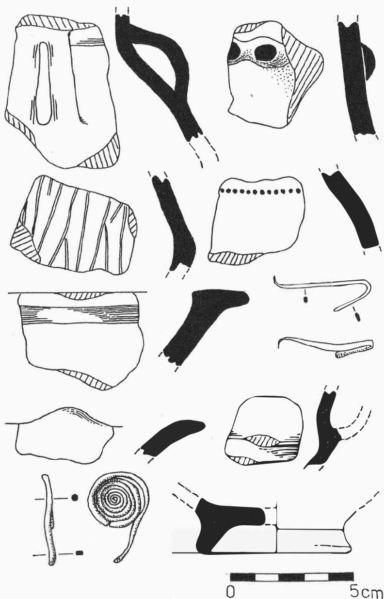
Obr. 1. Ohrozim (okr. Prostějov). Výběr materiálu

Ohrozim (Bez. Prostějov), Ost-Teil des Gemeidekatasters. Mitteldonauländischen Hügelgräberkultur. Oberflächenuntersuchung.